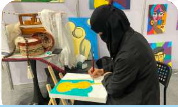
مشاركة الجمعية في معرض «الحرف والأعمال اليدوية»، 2025 م