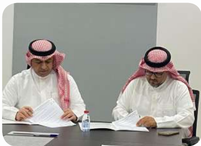
توقيع اتفاقية تعاون مشترك مع نادي الهداية الرياضي بالجش وذلك يوم الإثنين 17 مارس 2025 م.