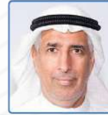
عبدالله أحمد عبدالله آل فردان نائب الرئيس