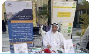
مشاركة مركز سنا للإرشاد الأسري في اليوم العالمي للصحة النفسية