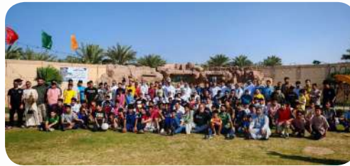
المشاركة في «ملتقى الأحباب 15»