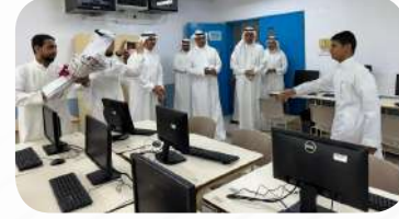
دعم معلمي الحاسب الآلي في مدرستي ثانوية تاروت (بنين) والمتوسطة الأولى بسنابس (بنات) بـ 51 جهازاً