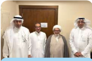
زيارة الشيخ محمود آل سيف