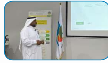
استضافة الجمعية لوحدة الخدمات الاجتماعية الداعمة بمحافظة القطيف للتعريف بخدماتها بمحاضرة تعريفية