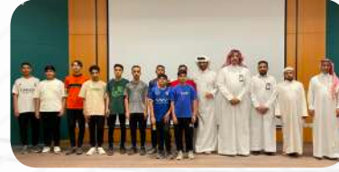
استضافة الجمعية عدد من طلاب مدرسة الساحل المتوسطة بتاروت،