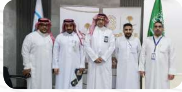
مبادرة «نأتي إليك» والمنفذة من وكالة وزارة الداخلية بمكتب إدارة الأحوال المدنية بمحافظة القطيف