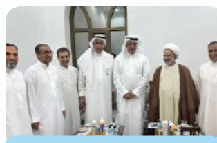
زيارة الشيخ فوزي آل سيف