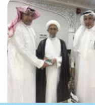
زيارة الشيخ حسن الصفار