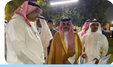
مشاركة الجمعية في فعالية الاحتفاء بيوم التطوع العالمي السعودي «خلود العطاء»