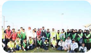
فعالية تنظيف كورنيش سنابس