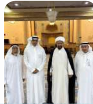
زيارة الشيخ مرتضى الماء