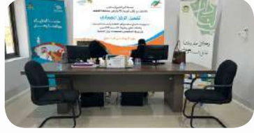
مبادرة الركن الضماني بالتعاون مع الضمان الاجتماعي بالقطيف