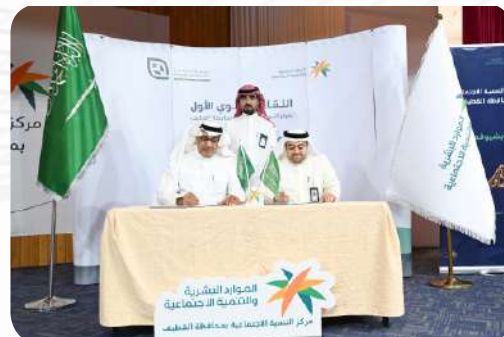
توقيع عدد من الاتفاقات مع عدد من الجمعيات في محافظة القطيف بهدف تبادل الخبرات والتعاون المشترك فيما بينهم في ملتقى تلاقي، المنظم من مركز التنمية الاجتماعية بمحافظة القطيف يوم الأربعاء 3 ديسمبر 2025 م