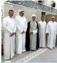
زيارة الشيخ علي الكواي