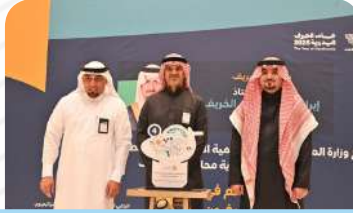
مشاركة الجمعية بركن تعريفى في فعالية حرفيون 4 بتاريخ 19 فبراير 2025م.