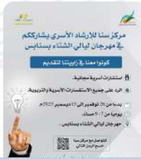
مشاركة مركز سنا للإرشاد الأسري في مهرجان ليالي الشتاء بسنابس