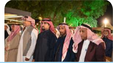
مشاركة الجمعية في فعالية «جزيرتنا خضراء» النسخة الرابعة، والتي انطلقت يوم الجمعة 17 يناير 2025م.