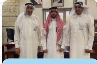
زيارة رئيس بلدية تاروت