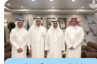
زيارة رئيس بلدية القطيف